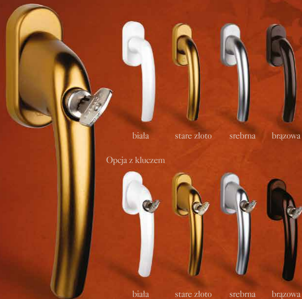
biała stare złoto srebrna brązowa

Do naszych okien proponujemy klamki w kilku wersjach kolorystycznych, standardowo wyposażone w blokadę błędnego położenia.