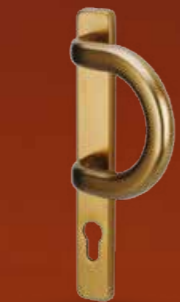
F4 – POCHWYT