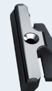
Incontro perimetrale standard